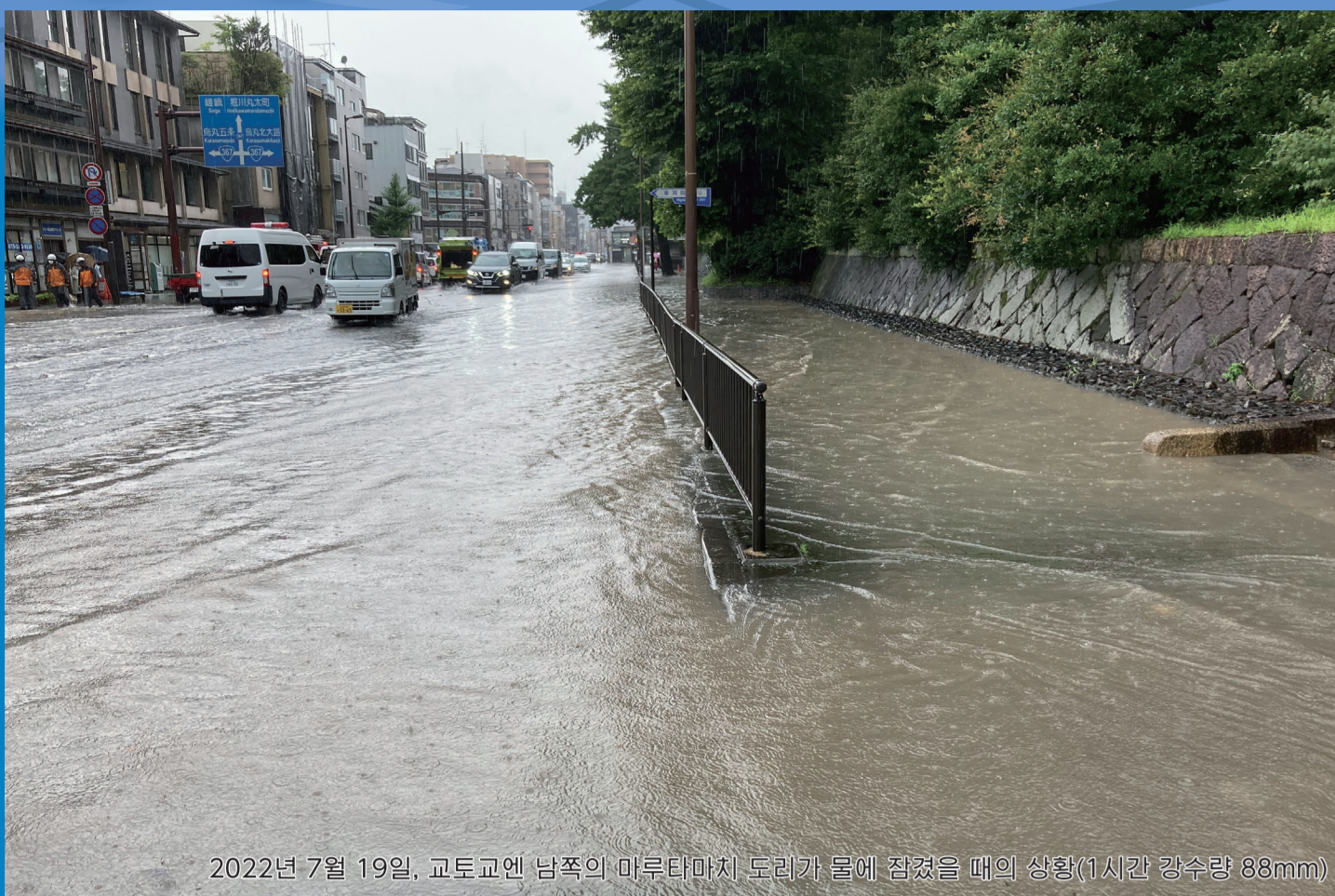
2022년 7월 19일, 교토역 남쪽의 이부타에서 무라카미가에 경정수 펌의 상류(시원량 수위 88mm)

교토 시내 내수 해저드맵에 대하여 「교토 시내 내수 해저드맵」은 예상 가능한 최대 규모의 강우*로 인해 하수나 수거가 범람할 경우의 침수 범위와 깊이 등의 정보를 정리한 지도입니다. 이 해저드맵은 시간(여러분)이 평소부터 대비하고, 호우 시 적절한 피난 행동을 취할 수 있도록 작성되었습니다. ※이 비는 약 1000년에 한 번 정도 오는, 매우 강한 비입니다(147mm/h). 하수도는 약 10년에 한 번 정도 오는 비(62mm/h)를 기준으로 만들어져 있지만, 이 비는 그 기준보다 훨씬 많은 비입니다.